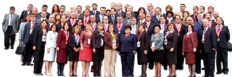
Participantes en la primera reunión preparatoria. XV edición

La metodología de trabajo de la Cumbre Judicial Iberoamericana consiste en la celebración, a lo largo de cada edición, de tres Reuniones Preparatorias, tres Rondas de Talleres y una Asamblea Plenaria final.