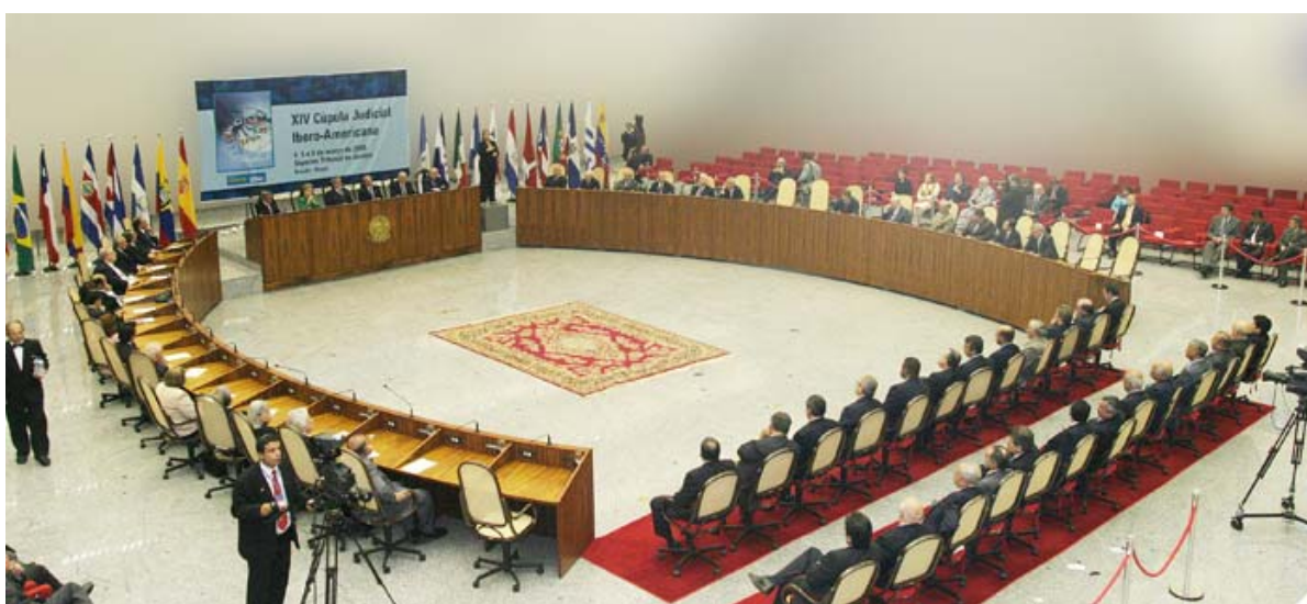
Asamblea Plenaria de la XIV Cumbre Judicial Iberoamericana. Brasilia. Marzo de 2008