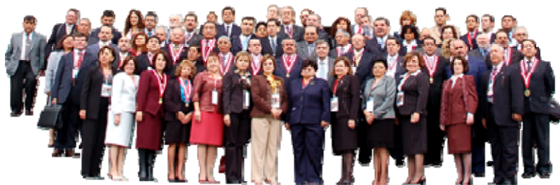
Participantes en la primera reunión preparatoria. XV edición

La metodología de trabajo de la Cumbre Judicial Iberoamericana consiste en la celebración, a lo largo de cada edición, de tres reuniones preparatorias, tres rondas de talleres y una Asamblea Plenaria final.