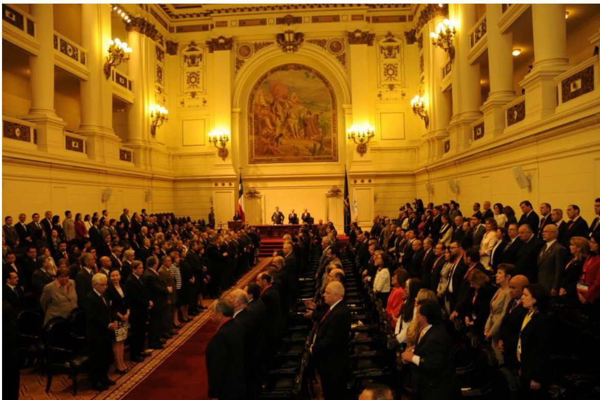
Asamblea Plenaria de la XVII Cumbre Judicial Iberoamericana. Santiago de Chile, Abril de 2014