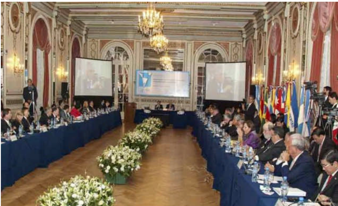
Asamblea Plenaria de la XVI Cumbre Judicial Iberoamericana. Buenos Aires, Abril de 2012

La Cumbre Judicial Iberoamericana ( www.cumbrejudicial.org ), La Cumbre Judicial Iberoamericana es una organización que articula la cooperación y