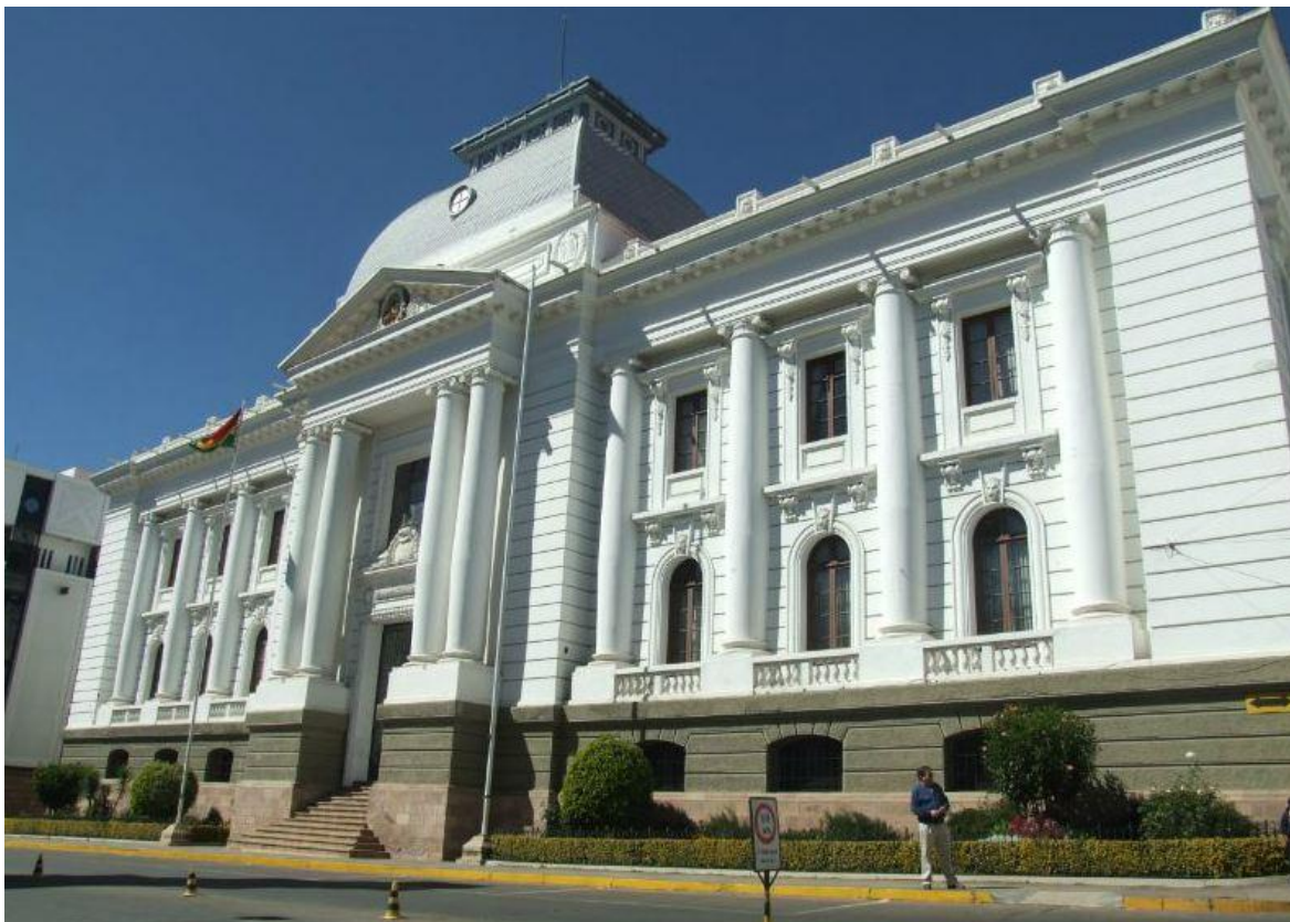
Edificio del Tribunal Supremo de Justicia del Estado Plurinacional de Bolivia

Las actividades de la Segunda Reunión Preparatoria se llevarán a cabo en la ciudad de Santa Cruz de la Sierra, Bolivia.