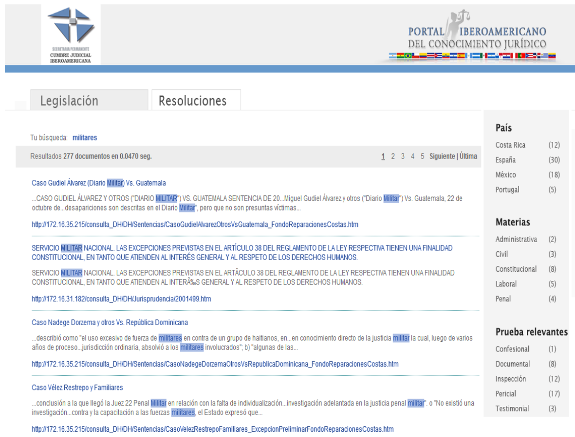
Ilustración 4. Consulta de información

Como se observa en la ilustración 4 , de la búsqueda directa de un tema, se presentan del lado derecho elementos auxiliares para delimitar el alcance de la consulta.