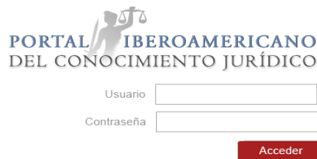
Ilustración 1. Ingreso controlado al Portal