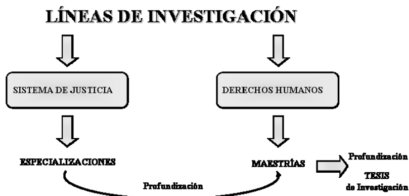
Figura No. 3:

Concatenado con lo anteriormente presentado, las potenciales Líneas de Investigación de la Institución, en esta primera propuesta, podrían estructurarse de acuerdo con el contenido de los siguientes cuadros: