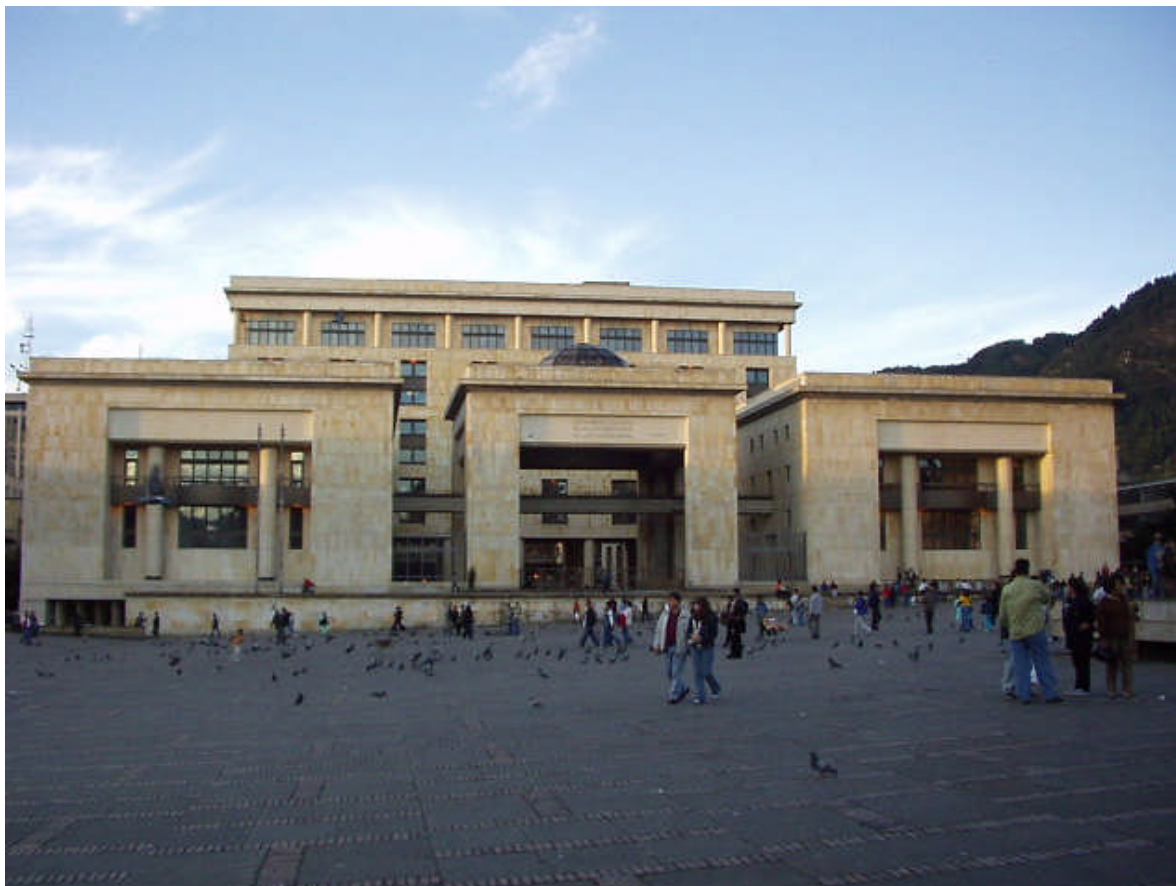
Palacio de Justicia de Colombia

Las actividades de la Segunda Ronda de Talleres se llevarán a cabo en Bogotá Distrito, Capital de Colombia.