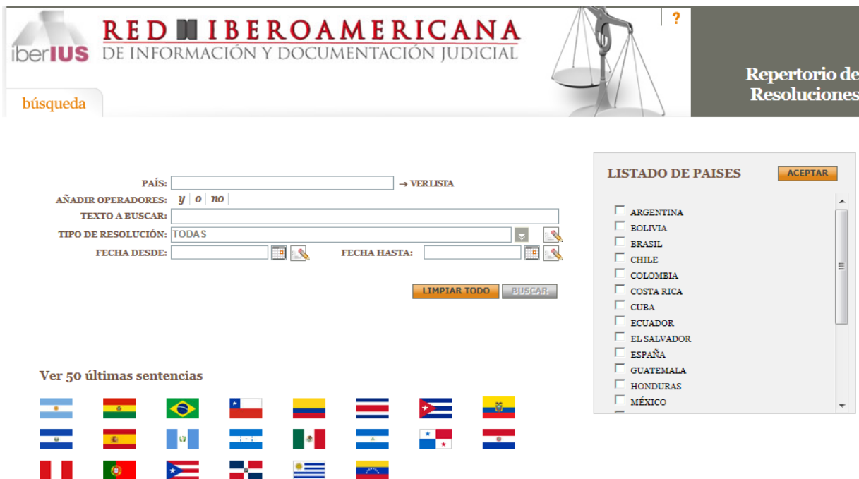
Figura 1. Interfaz actual del componente de consulta del Portal Iberoamericano del Conocimiento Jurídico

El componente de consulta de información utilizará el índice generado por el Componente Integral de compilación de información, para la rápida localización de jurisprudencia y legislación, además presentará la lista de resultados agrupados y clasificados lo que le permitirá a los usuarios “navegar” por todo el conjunto de información y acotar los resultados sin tener que realizar una nueva consulta.