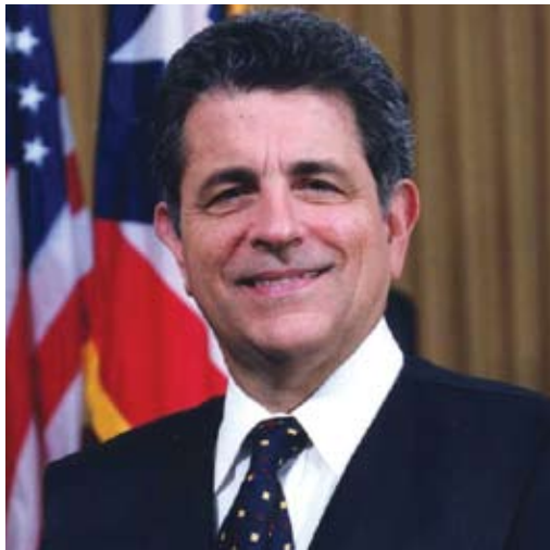
Federico Hernández Denton Juez Presidente del Tribunal Supremo

Realizar de tiempo en tiempo un sosegado autoexamen que permita identificar fortalezas, limitaciones, metas logradas y retos inconclusos, se presenta como imperativo ineludible para todos los servidores públicos. Esa mirada al interior, desapasionada, juiciosa, sincera, abierta, permite evaluar cómo se ha cumplido con su responsabilidad, cómo se ha respondido a las exigencias sociales y qué se debe hacer para que esa respuesta sea más eficiente, más competente.